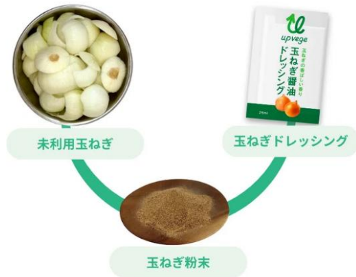
未利用だった玉ねぎが、粉末に加工することで、新しいドレッシングに生まれ変わりました

富士シティオは、三菱食品株式会社（以下、三菱食品）、株式会社グリーンエース（以下、グリーンエース）、浜食産株式会社（以下、浜食産）と共同で、未利用玉ねぎを活用した商品「玉ねぎ醤油ドレッシング」を開発し、販売を開始いたしました。